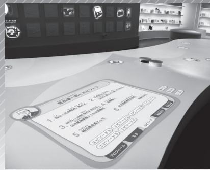
偉人との出会いゾーン