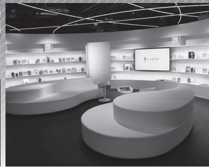
探求・交流ゾーン