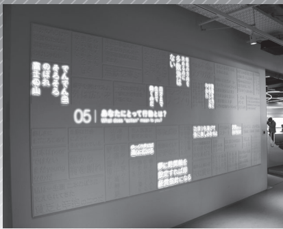
偉人のトイカケゾーン

トヨタグループ創始者の豊田佐吉氏をはじめ愛知県にゆかりのある企業家の功績などを伝えるあいち創業館(ステーションAi 2階)が明日オープンする。4つのゾーンで構成され、メディアテーブルやプロジェクションマッピングなど趣向を凝らした演出で、企業家のエピソードや産業のルーツを紹介する。ステーションAiに集うスタートアップの挑戦を後押しするとともに、社会見学などで訪れる子どもたちに起業家としての夢を育むのが狙い。入館無料。営業時間は午前9時30分から午後5時まで。